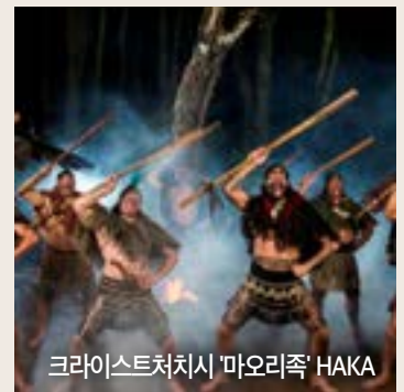
크라이스트처치시 '마오리족' HAKA