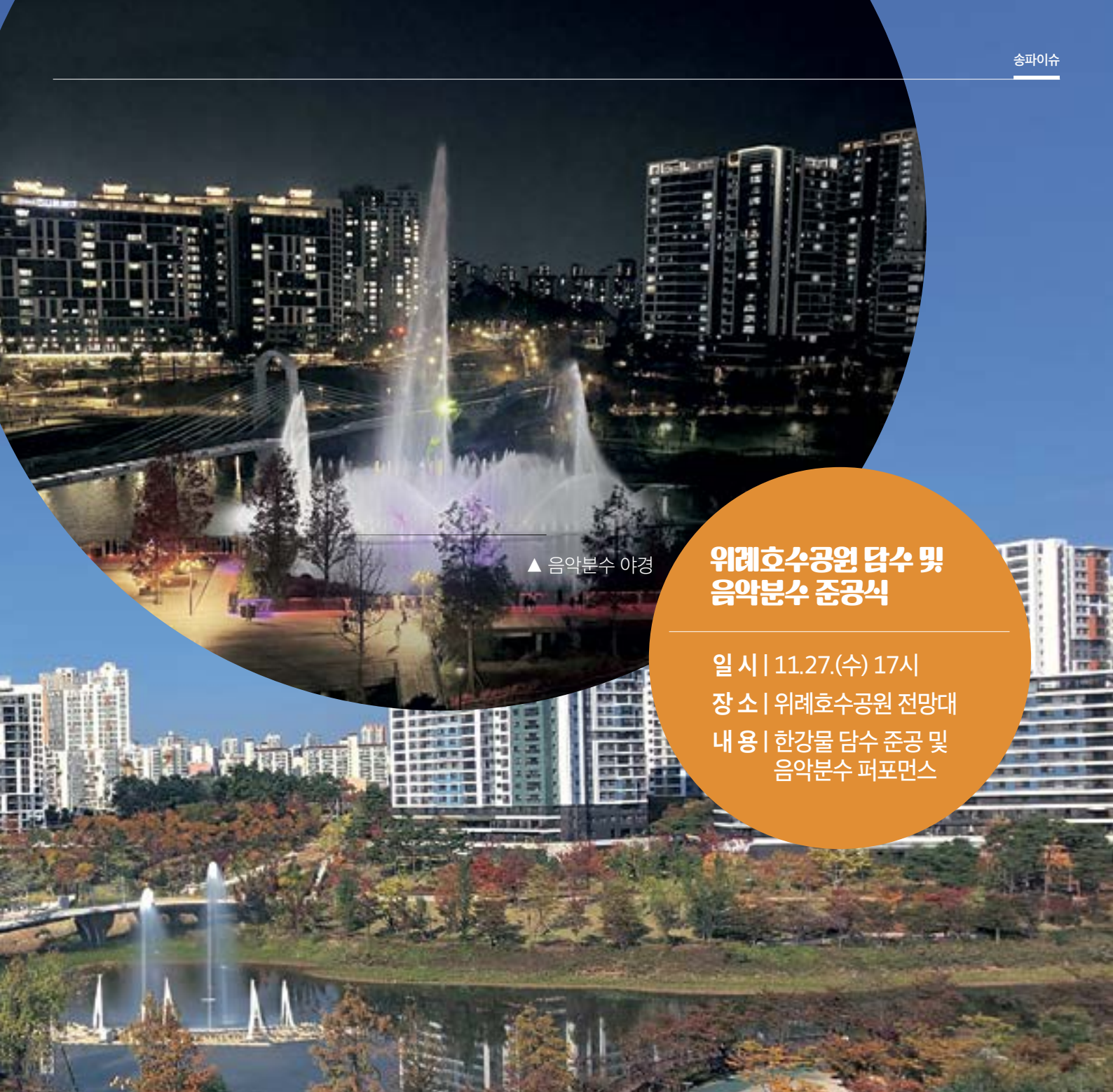
▲ 음악분수 야경