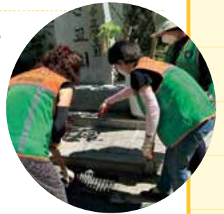
자율방재단 빗물받이 점검

안전한 동네를 위해 동네 곳곳을 꼼꼼하게 순찰하고 안전신문고를 통해 구청에 알려 개선하고 있습니다. 이웃 주민을 위해 봉사할 수 있어 항상 기쁨과 보람을 느낍니다.